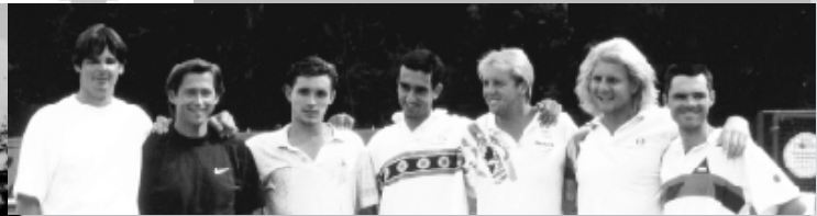
Die Württembergische Vizemeister-Mannschaft